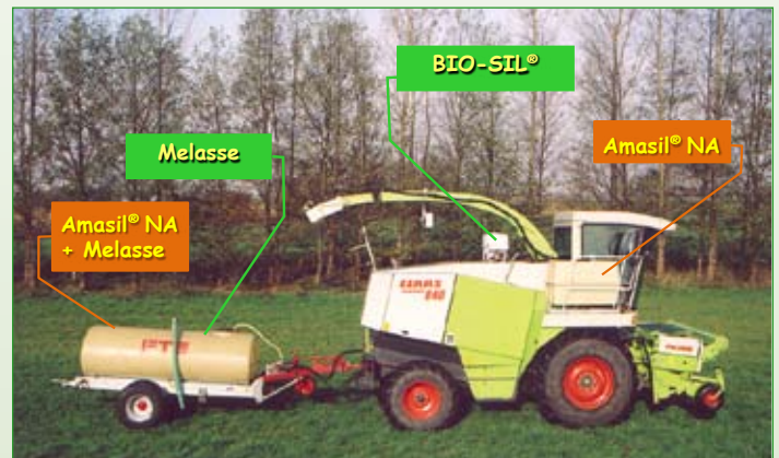
Technische Lösung zur getrennten Applikation von BIO-SIL® und Melasse bzw. Amasil® NA

BIO-SIL® und Amasil® NA sind für den ökologischen Landbau zugelassen.