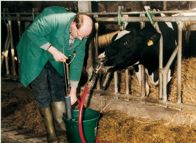
Abb.2: Applikation des Drenchgemisches

Zunächst sollte eine kleinere Menge (ca. 5 l) appliziert werden. Die Kuh darf dabei nicht würgen, sonst stimmt etwas nicht. Dann muss der Sitz der Sonde nochmals überprüft werden. Wenn alles in Ordnung ist, wird die Drenchlösung in den Pansen gepumpt.