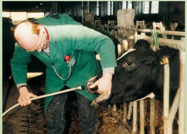
Abb.1: Einführung der Schlundsonde

Das Drenchen sollte innerhalb der ersten 4 Stunden, besser aber innerhalb der ersten 2 Stunden nach dem Kalben vorgenommen werden.